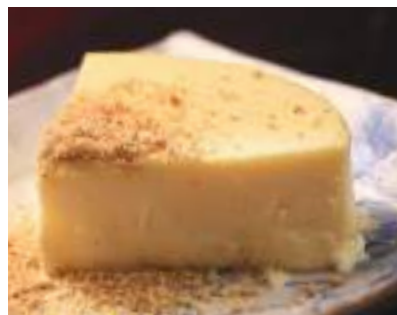
ニューヨーク チーズケーキホール(13cm) 1,944円