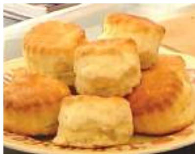
松之助ビスケット 5個入り 1,000円