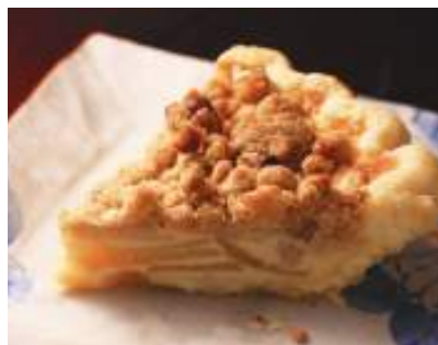
サワークリーム アップルパイホール(18cm) 2,592円

京都松之助N.Y.の美味しいケーキのお持ち帰り用です。 作りたてを冷凍いたしました。 自然解凍1~2時間でお召し上がりいただけます。